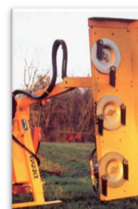
Lamier à couteaux