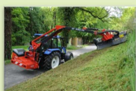
Épareuse à rotor