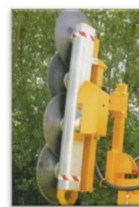
Lamier à scies